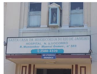
Asilo Socorrinho - Caju - RJ

O Asilo Socorrinho, é um hospital-abrigo administrado pela Santa Casa de Misericórdia, sediado em um antigo e belo prédio no Caju. Abriga atualmente treze idosos e 14 idosas. Esta instituição conta com a ajuda de algumas empresas, entidades e de vários grupos de voluntários que proporcionam passeios, tardes dançantes, alimentos e até obras de reforma na casa. Some-se a isso a enorme dedicação dos funcionários, que, como temos visto, têm tido muitas dificuldades para receberem seus vencimentos mensais.